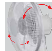
Inclinazione regolabile e oscillante.